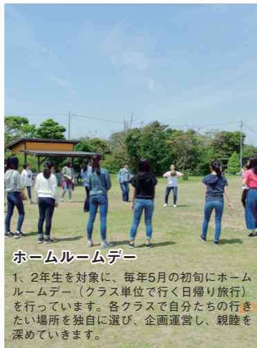
ホームルームデー

1、2年生を対象に、毎年5月の初旬にホームルームデー（クラス単位で行く日帰り旅行）を行っています。各クラスで自分たちの行きたい場所を独自に選び、企画運営し、親睦を深めています。