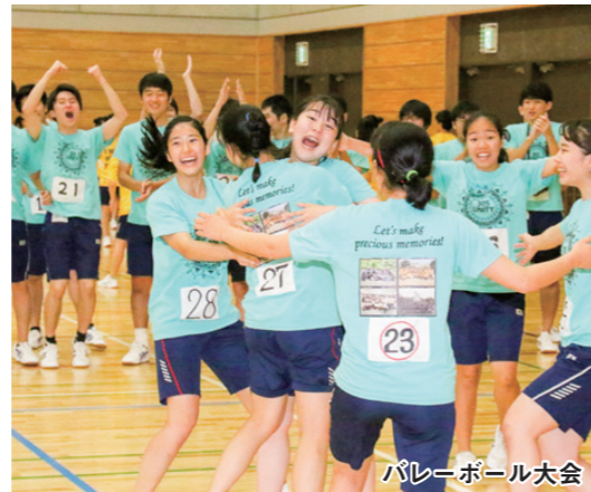
バレーボール大会