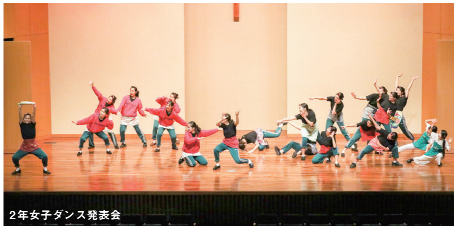
2年女子ダンス発表会