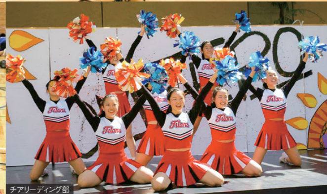
チアリーディング部