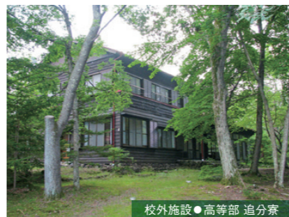
校外施設 ● 高等部 追分寮