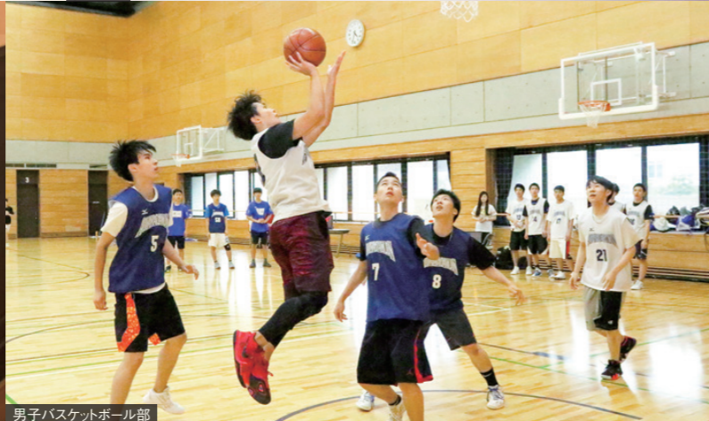
男子バスケットボール部