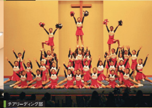
チアリーディング部